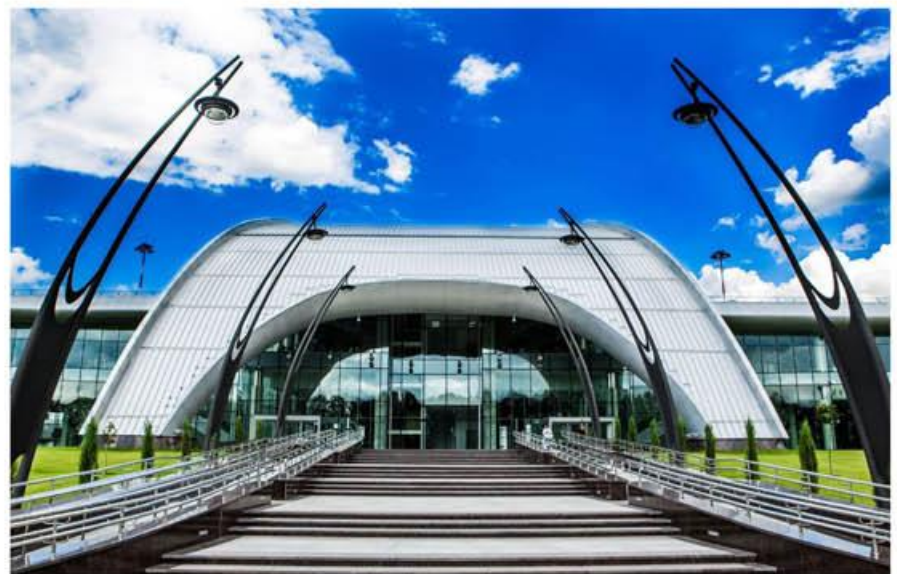
Основной вход в здание аэровокзала в аэропорту г. Белгорода

Аэровокзал включает двухуровневый комплекс с подъездной