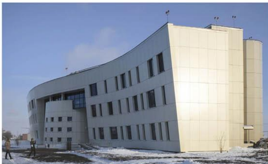
Авиационный поисково-спасательный центр в аэропорту Курумоч г. Самара

По итогам Всероссийского конкурса на лучший инновационный проект, проводимого Национальным объединением изыскателей и проектировщиков (НОПРИЗ), проекты, разработанные специалистами ФГУП ГПИ и НИИ ГА «Аэропроект», вошли в число лучших в России в части применения инноваций.