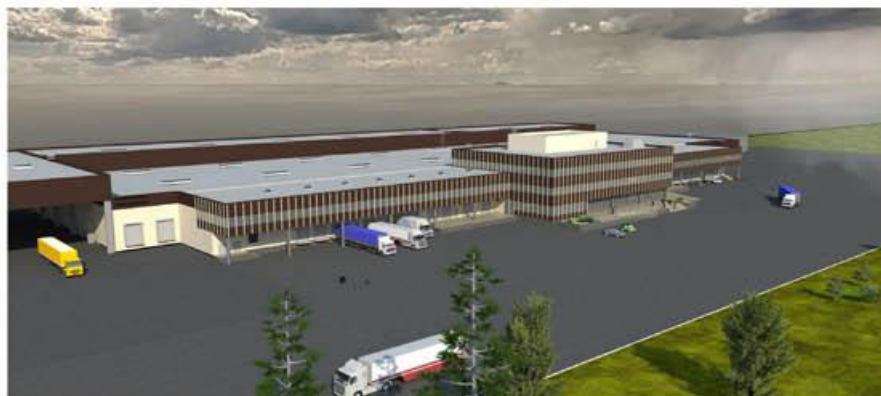
Проект строительства грузового терминала на территории ОАО «Шереметьево-Карго» в городском округе Химки Московской области Общий вид со стороны въезда

Высокая оценка представленных на конкурс проектов является показателем безупречного качества проектирования, высокого уровня технологических решений и эффективности управления рабочими процессами ФГУП ГПИ и НИИ ГА «Аэропроект». 📍