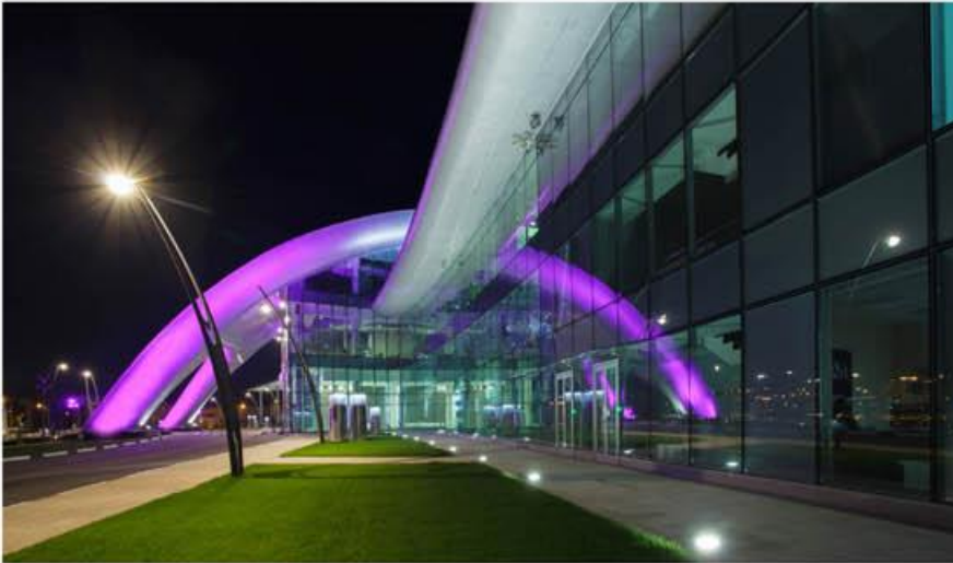
Фрагмент подсветки здания аэровокзала в аэропорту г. Белгорода

эвакуации космонавтов, спускаемых космических объектов или их аппаратов с места посадки.