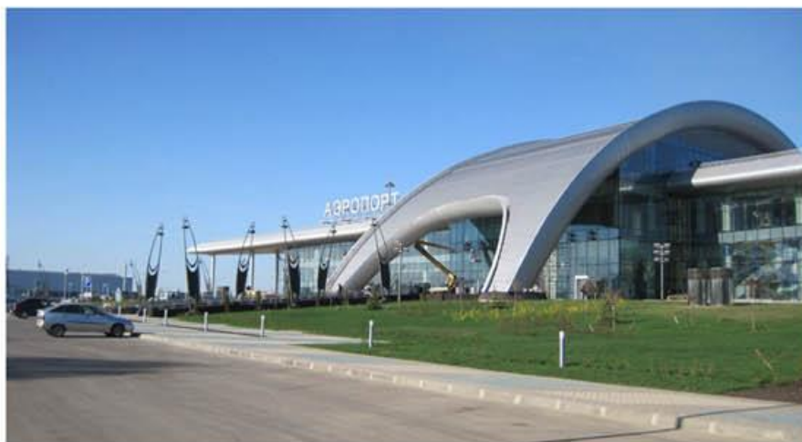
Аэровокзал в аэропорту г. Белгорода

Проект авиационного поисково-спасательного центра с координационным центром поиска и спасения (АПСЦ) в аэропорту Курумоч города Самара занял третье место в номинации «Лучший проект административного здания». Это новый тип строения для гражданской авиации, которое запроектировано и построено впервые в России в соответствии с ФЦП «Модернизация Единой системы организации воздушного движения РФ (2009–2015 годы)». Оно предназначено для организации и проведения поиска и спасения терпящих или потерпевших бедствие воздушных судов всех видов авиации, их пассажиров и экипажей, поиска и