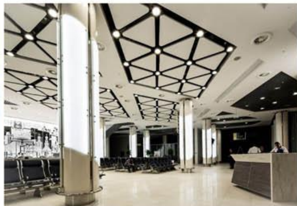
Интерьер в аэропорту г. Белгорода

эстакадой для разделения пассажиропотоков на начальных этапах передвижения по нему и железнодорожной станцией для удобного транспортного сообщения с городом. Таким образом, вылетающие пассажиры прибывают сразу на уровень вылета. Зона прилета расположена на первом уровне — непосредственно на уровне земли.