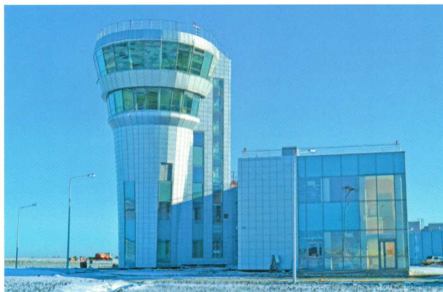
Командно-диспетчерский пункт в аэропорту Белгород

В настоящее время специалистами института начато проектирование аэровокзального комплекса международных и внутренних воздушных линий аэропорта Волгоград, аэровокзальных комплексов аэропортов Хабаровск (Новый), Ростов-на-Дону (Южный), аэропортового комплекса Новосибирск (Толмачево) и ряд других.