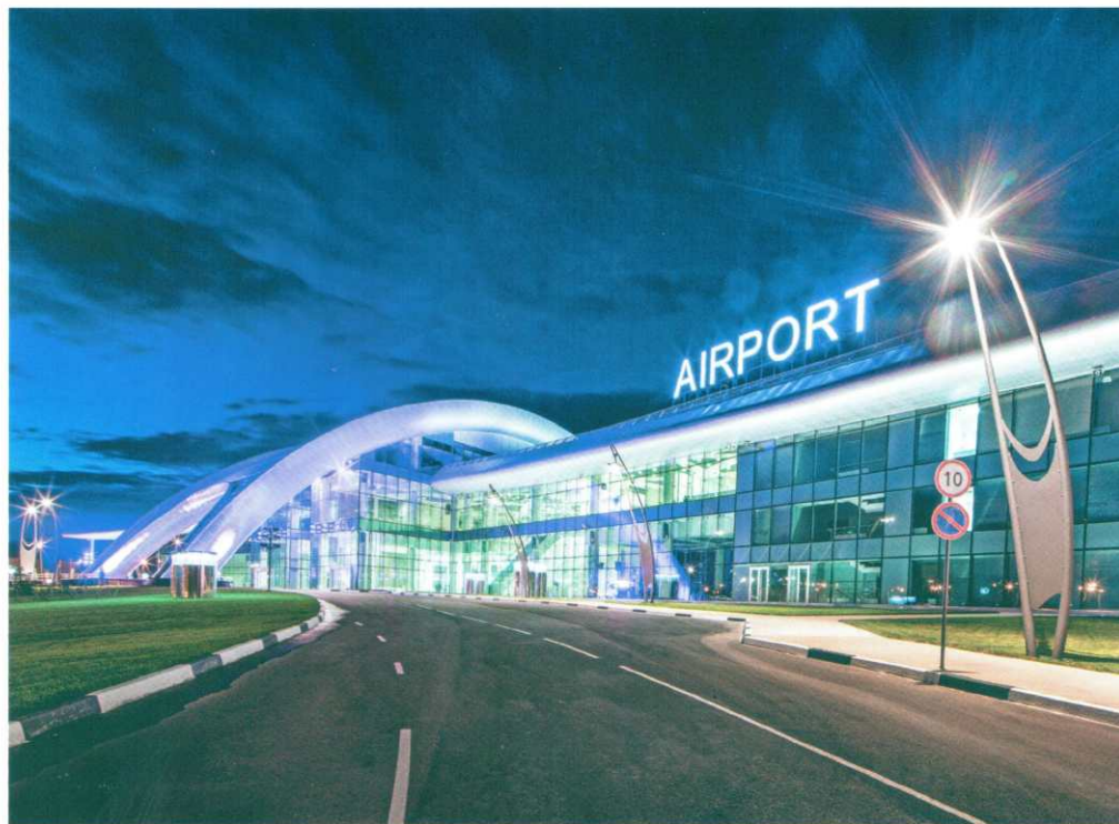
Аэровокзал в аэропорту Белгород

В послевоенные годы специалисты «Аэропроекта» обеспечили восстановление аэропортов и спроек-